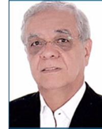
EZEQUIAS Nº 01

REGIÃO 4: DF, BA, SE, AL, PE, CE, RN, PB, PI, MA, PA, AM, AC, RO, RR e AP