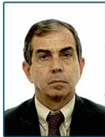
GIRÃO Nº 13