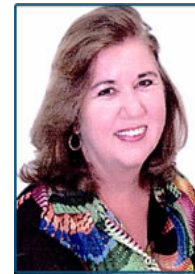
FLORDELIZ Nº 02

REGIÃO 2: MG, ES, PR, SC, RS, MT, MS, TO, GO, DF, BA, SE, AL, PE, CE, RN, PB, PI, MA, PA, AM, AC, RO, RR e AP